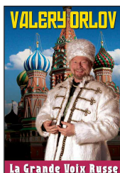
La Grande Voix Russe